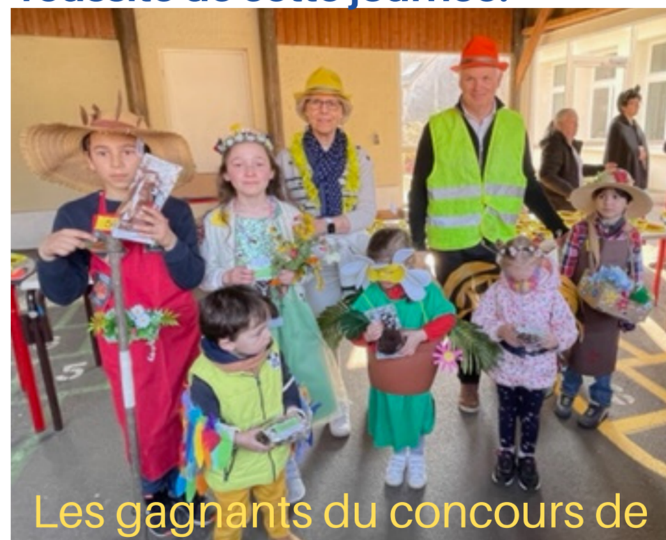
Les gagnants du concours de déguisement