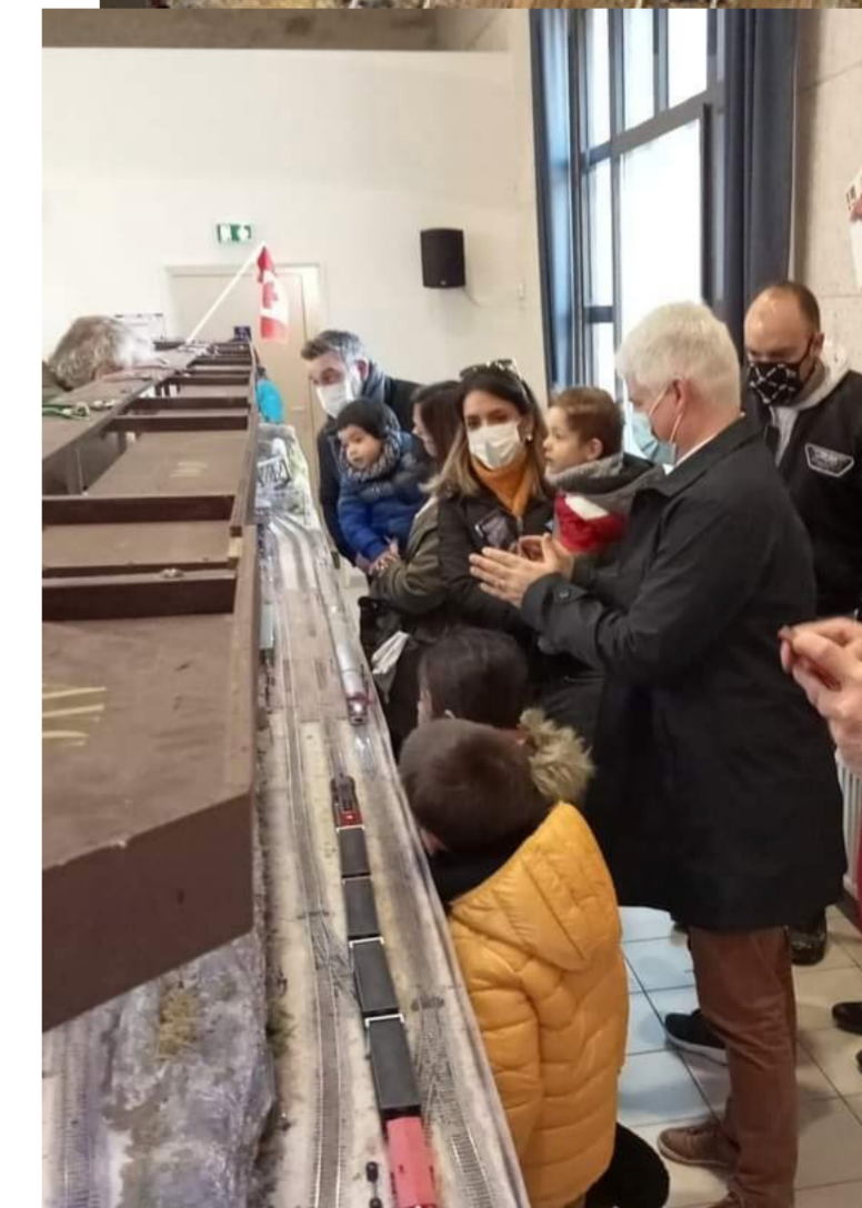
Petits et grands se sont régalés. Un grand merci à tous les passionnés de l'ADDF