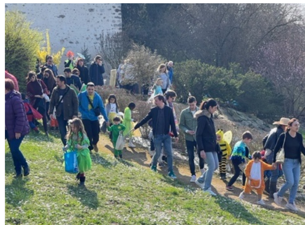
L'ouverture de la chasse aux oeufs et l'au revoir à Bineau