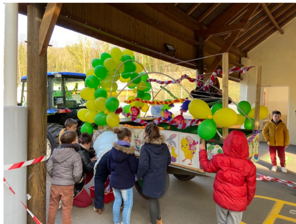
Les enfants décorent le char

Un grand merci à tous pour votre participation et un grand bravo à tous les bénévoles qui ont contribué à la réussite de cette journée.