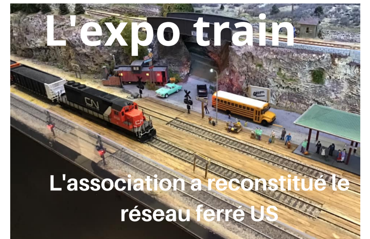
L'association a reconstitué le réseau ferré US