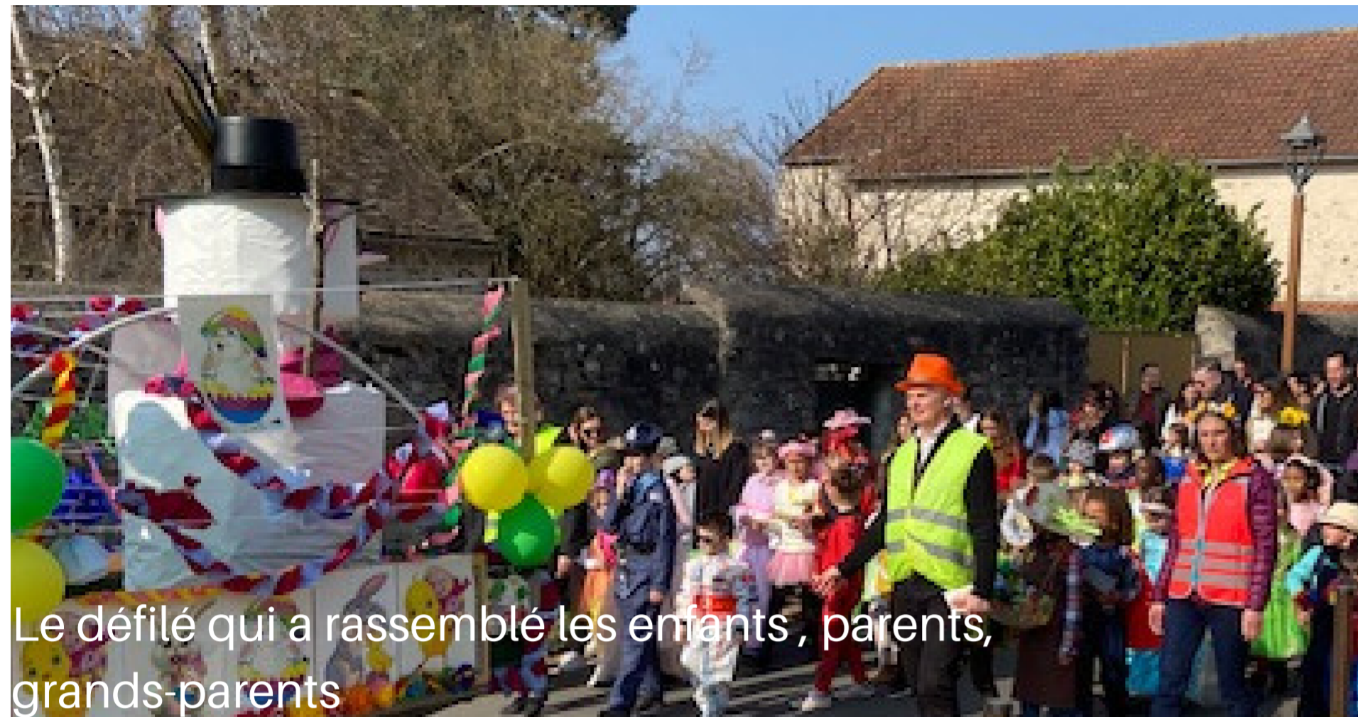
Le défilé qui a rassemblé les enfants, parents, grands-parents

Deux ans sans carnaval.... Tout était au rendez-vous Le thème: le printemps Le temps magnifique Les enfants merveilleusement déguisés Les participants, petits et grands de bonne humeur